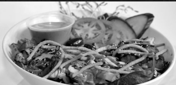
STEAK POÊLÉ - 10 OZ